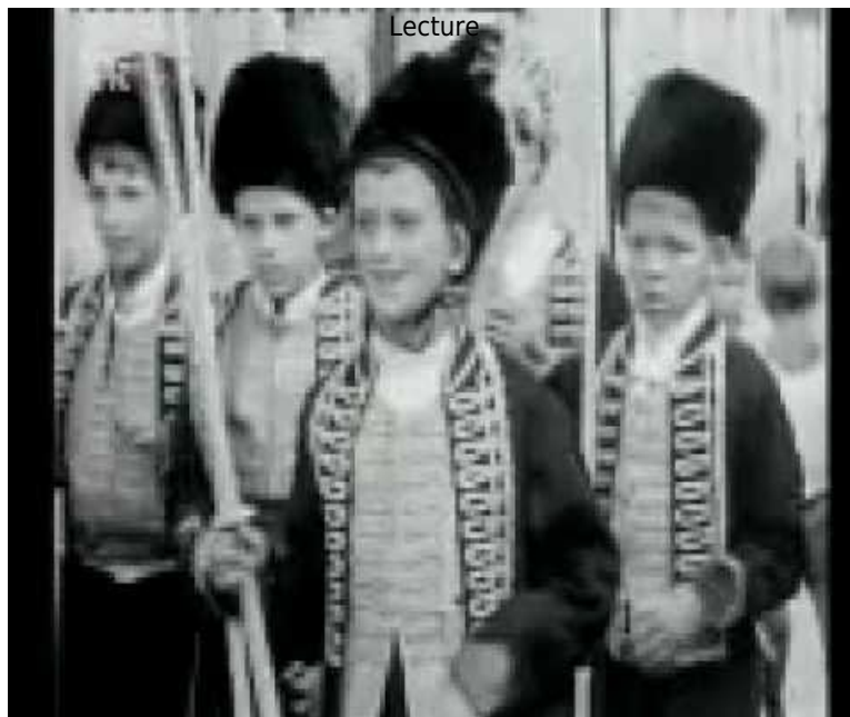
Vidéo 3 Mladen Delić, 1965. Mladi Alkari (11' 45") (consultée le 13 novembre 2018).

l'habileté du cavalier sont déterminants dans ces jeux dont la dimension spectaculaire est souvent exploitée, à l'instar de la fantasia saharienne, ce « jeu de la poudre » où un groupe de cavaliers montés sur des chevaux ou des dromadaires simule une attaque en tirant au galop comme un seul homme.