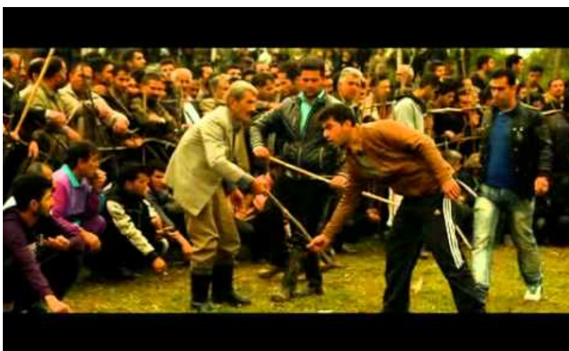
Vidéo 5 Bande-annonce du documentaire de Mehrdad Ahmadpour et Morvarid Peyda, 2013. Sokout-e Barre (2' 18") (consultée le 13 novembre 2018).

que la société occidentale moderne entretient un rapport ambigu avec la représentation de la mort et de la brutalité). De manière générale, nombre de ces jeux posent la question – irrésolue depuis Aristote – de l'effet cathartique (ou, au contraire, amplificateur d'une pulsion agressive) que susciterait la vision d'un acte perçu comme violent. Or, si ces moments sont souvent vécus avec passion, on constate qu'ils permettent aussi aux spectateurs ou aux parieurs d'exercer le contrôle de leurs propres émotions. Sauf exception, la fin tragique d'un coq dans l'arène ne se transforme jamais en rixe funeste. Par ailleurs, on ne saurait spéculer a priori que toute organisation de combats mortels ou sanglants suppose des acteurs humains indifférents à la sensibilité animale ; la conscience que l'animal souffre peut même intensifier les projections que les humains font sur les animaux qu'ils dressent l'un contre l'autre.