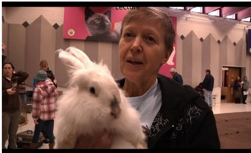
Vidéo 6 North Metro TV, 2014. Hot, Jump and Play. A Rabbit Agility Documentary (15' 57") (consultée le 13 novembre 2018).