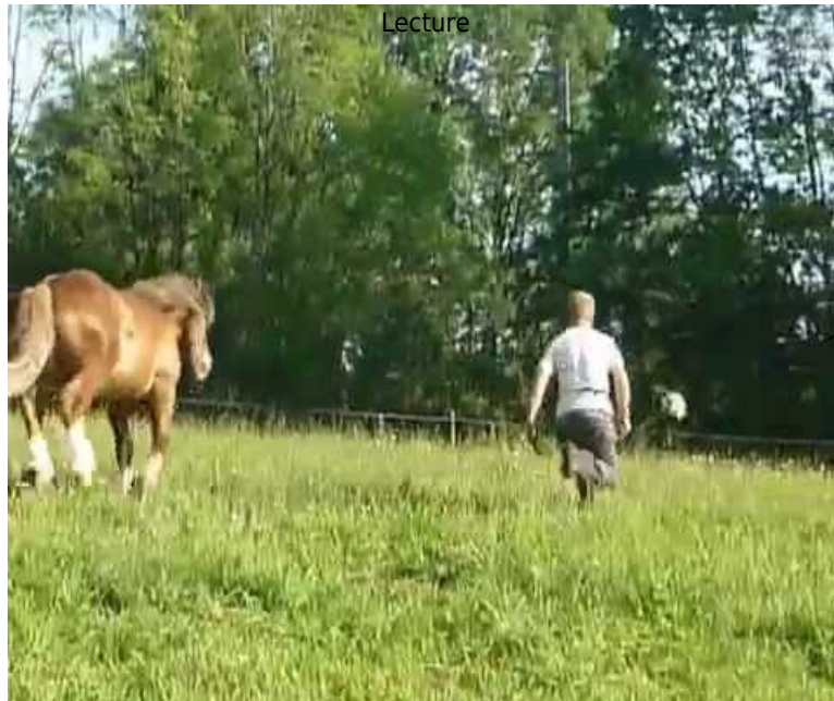
Vidéo 1 « Cheval de trait qui joue au foot Bambou », vidéo déposée sur le site YouTube par Lisapuce le 26 avril 2014 (consultée le 13 septembre 2018).

Un exemple parmi beaucoup de ces vidéos amateurs qui prennent comme sujet un animal qui joue. Présenté comme un cheval de trait breton rescapé de la boucherie, Bambou joue au ballon avec un humain et incarne ainsi l'évolution notée par Digard (1995).