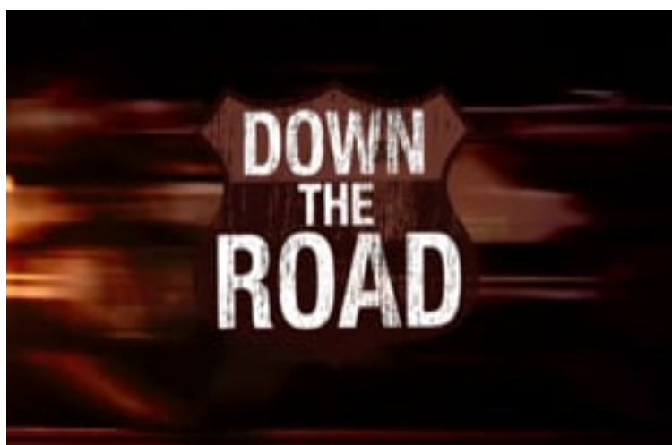
Vidéo 4 Clover and Rachel Carroll, 2013. Down the Road : Armadillo Racing (13' 10")

Une caractéristique sociale de ces courses est qu'elles s'accompagnent volontiers de prix et de paris. Le maître de maison ou le prince offre des objets de valeur aux participants ; les propriétaires et les spectateurs s'impliquent en misant des biens précieux ou de l'argent. Le jeu de la course se double d'un jeu du pari ou d'un jeu du potlatch. Par rapport aux “combats” qui connaissent les mêmes dispositifs mais n'aboutissent qu'à une opposition gagnant/perdant, les courses se distinguent néanmoins – dès qu'elles rassemblent plus de deux concurrents – par un résultat en forme de liste ordonnée. D'où l'équivalence structurale que peuvent prendre, dans cette perspective, courses avec paris et loteries [23].