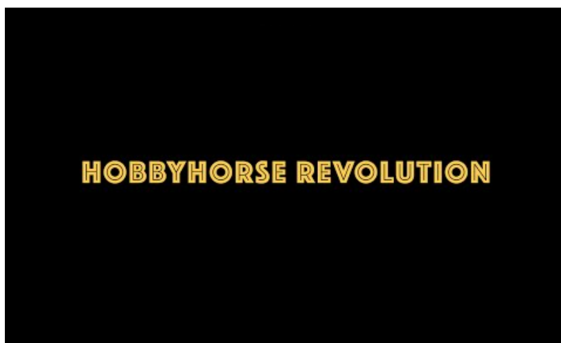
Vidéo 9 Bande-annonce du film de Selma Vilhunen, 2017. Hobbyhorse Revolution (2' 44") (consultée le 13 novembre 2018).